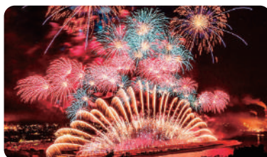
やつしろ全国花火競技大会