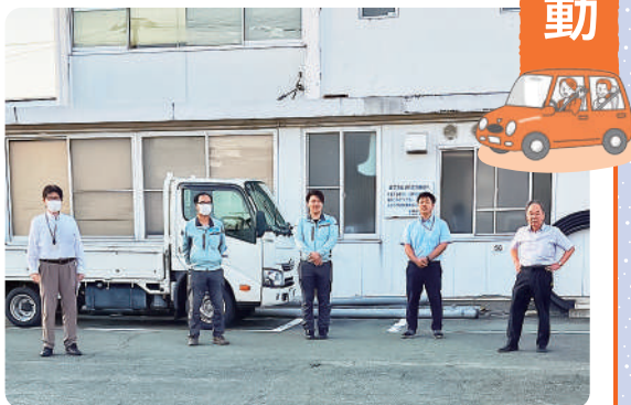
シートベルト着用チェック中