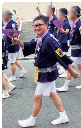
藤崎宮例大祭に参加しました！